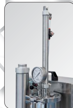
sistema per la strizzazione automatica

R01-10/09 - Subject to change without notice