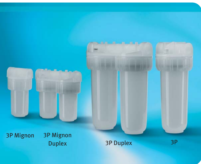
3P Mignon 3P Mignon Duplex