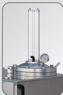
sistema per la strizzatura automatica (modello da 5 - 10 - 20 - 30 - 40 l)