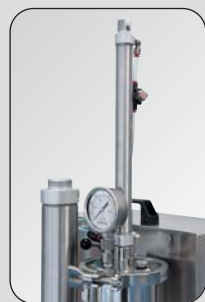
sistema per la strizzatura automatica (modello da 500 - 1000 - 2000 cc)